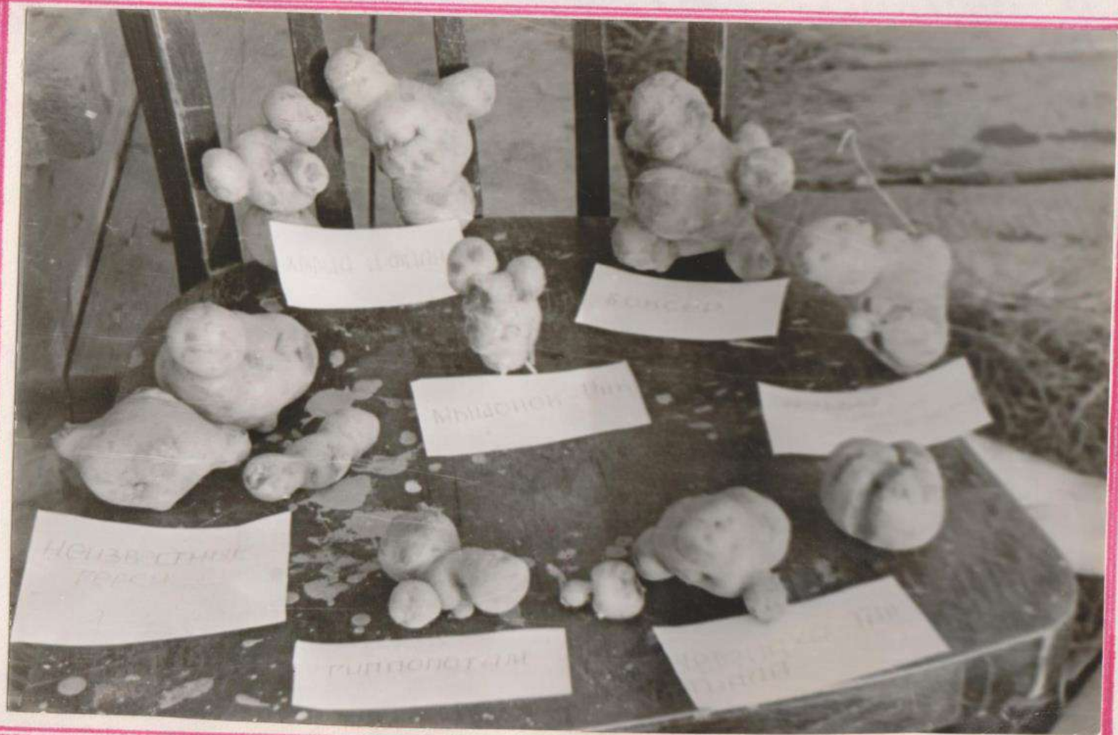
ЧУДО ПРИРОДЫ С ЕЖОВСКИХ ПОЛЕЙ