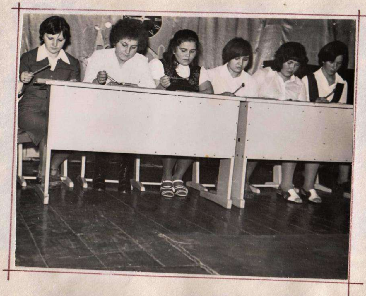
ВЫСТУПАЕТ ОРКЕСТР ДЕТСКИХ МУЗЫКАЛЬНЫХ ИНСТРУМЕНТОВ.