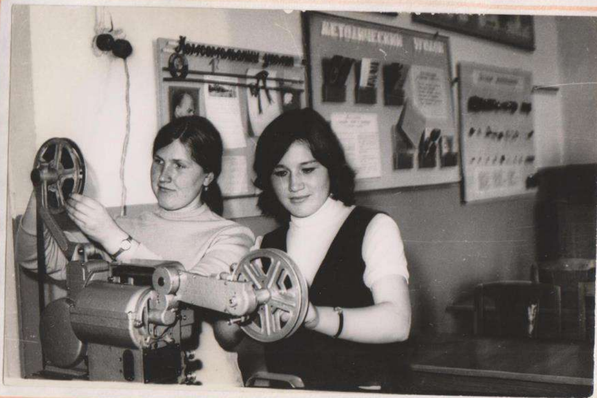
КРУЖОК ПО ИЗУЧЕНИЮ ТЕХНИЧЕСКИХ СРЕДСТВ