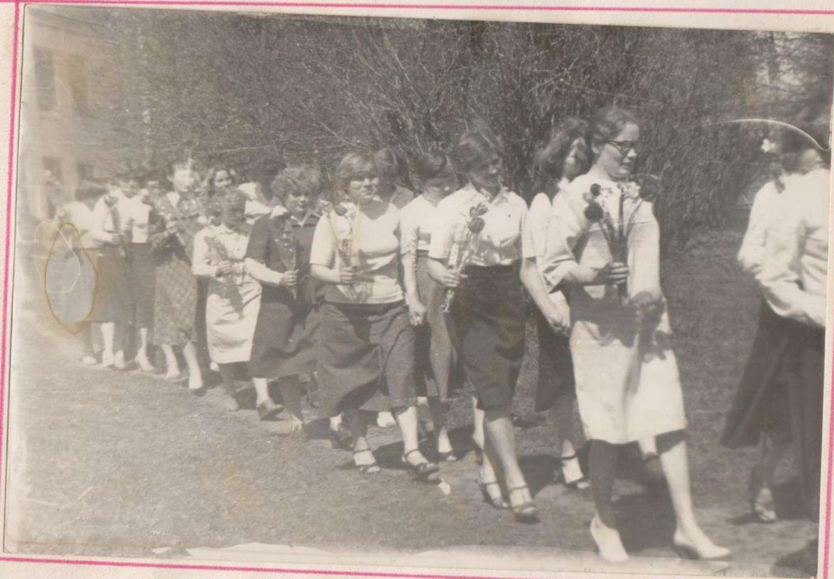
НА ПОСЛЕДНИЙ ЗВОНК