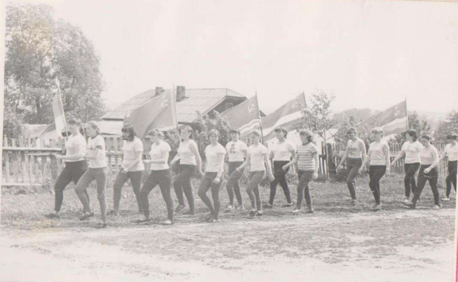
СПОРТПРАЗДНИК. ЛЕТНЕЕ МНОГОБОРЬЕ ГТО.