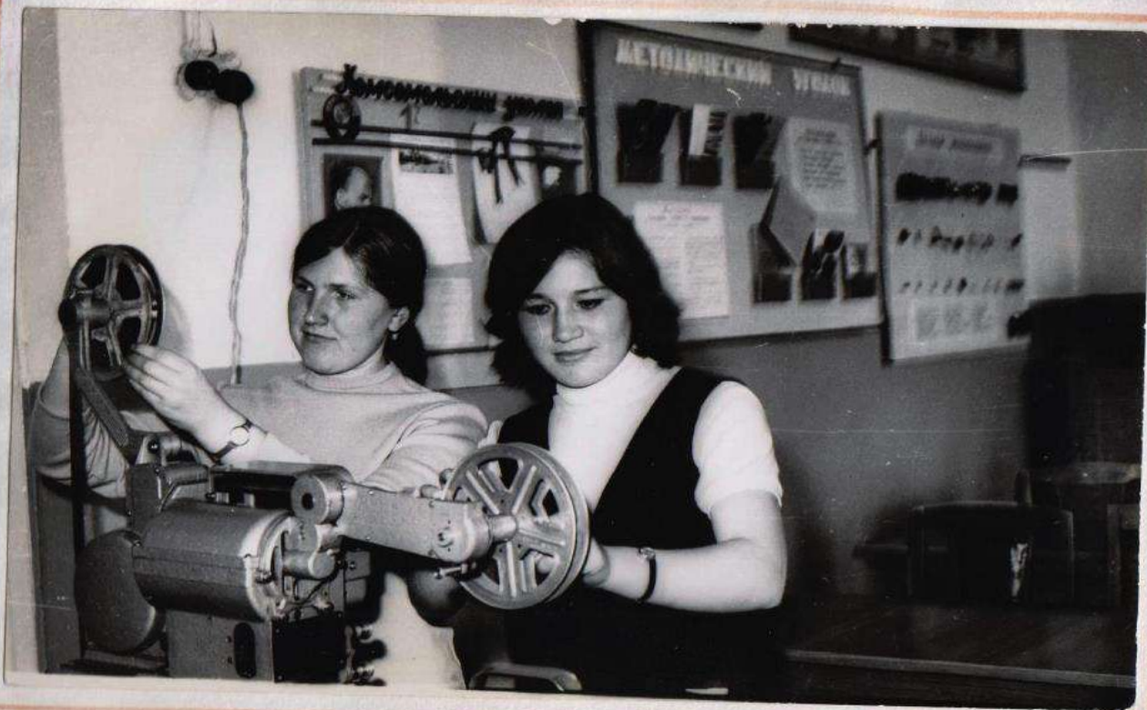
КРУЖОК ПО ИЗУЧЕНИЮ ТЕХНИЧЕСКИХ СРЕДСТВ